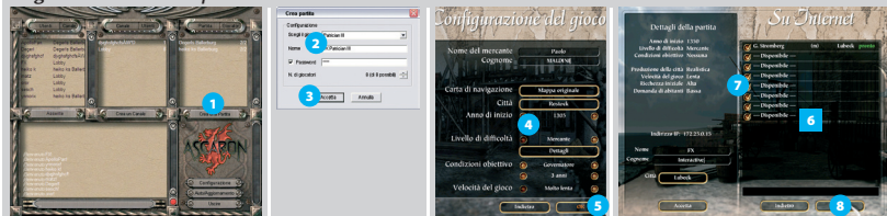
Figura 15-3: Crea una partita