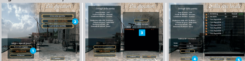
Figura 15-4: Unirsi a una partita