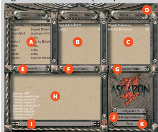
Figura 15-2: Schermata principale

Da questa schermata puoi accedere a tutte le opzioni del server. Quando si apre entri direttamente nel "Canale principale" dove puoi vedere l'elenco dei giocatori connessi e unirti a una partita cliccando sul suo nome. Se vuoi puoi anche accedere ad altri canali o crearne uno privato.