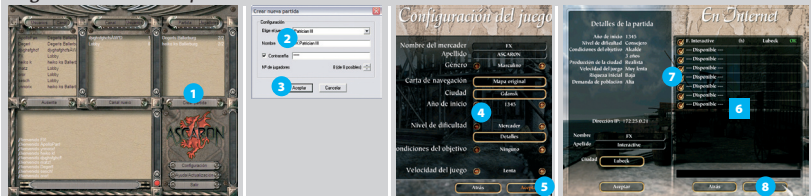
Figura 15-3: Crear una partida