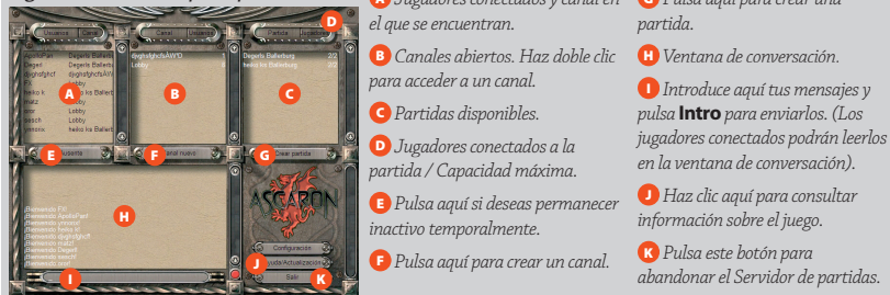
Figura 15-2: Pantalla principal

❖ Sólo puedes enviar mensajes a los jugadores que se encuentren en el mismo canal que tú.