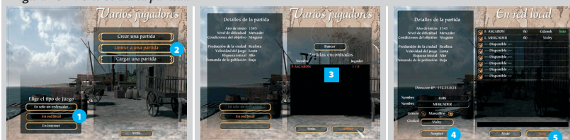
Figura 15-4: Unirse a una partida