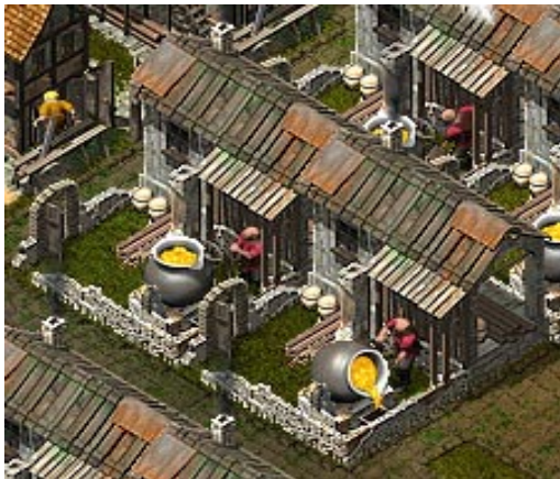
La fundición trabaja a pleno rendimiento.