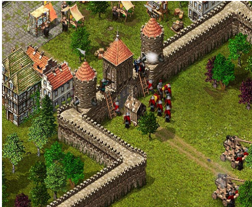
Los soldados defienden Londres del asedio enemigo.