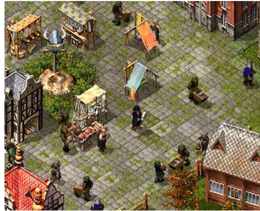
Los habitantes de Londres acuden a la plaza para escuchar el edicto del gobernador.