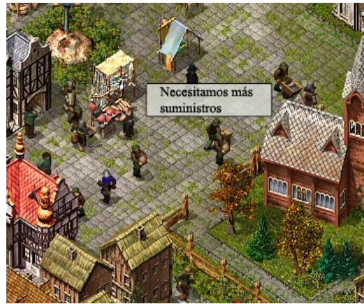
Los habitantes de tu ciudad te darán valiosas pistas.